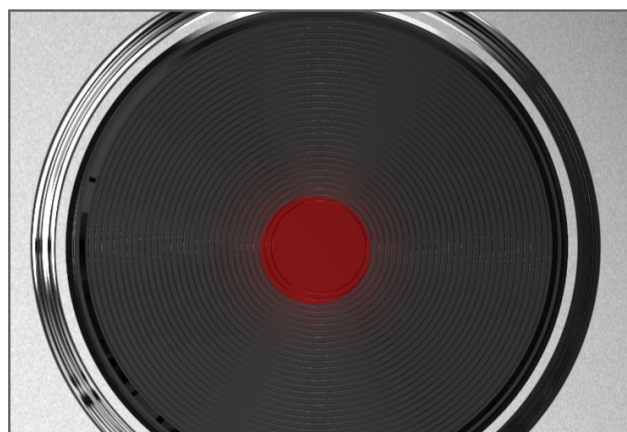
Brza grijača ploča snage 1.5kW